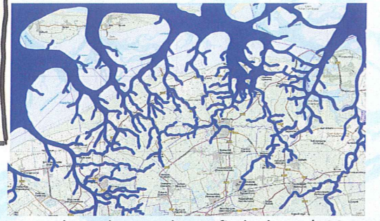
Zeegeulen volgens paleografische kaart (100 A.D.)

Sloepjes, camping, waard van Ternaard en verhalen Spaanse Peal en Ierdappels